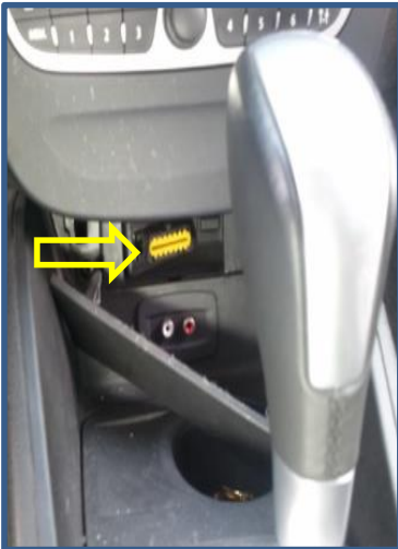
뉴 sm3 (신형)